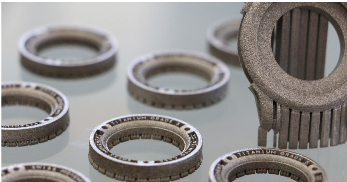
Ohišje ure 'Ornament 1', natisnjeno iz titana na sistemu Renishaw AM 400

Michiel je tako v sodelovanju s tem ponudnikom pripravil prototipe za uro 'Ornament 1' po postopku 3D-tiskanja na sistemu Renishaw AM250.