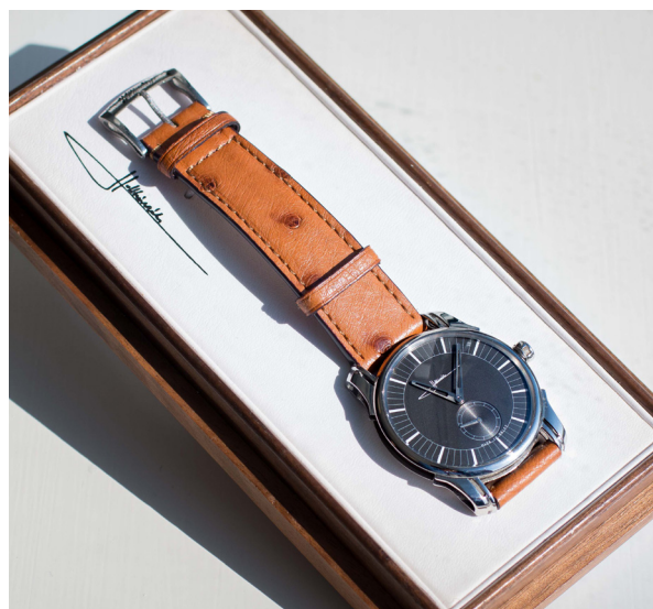
Ura Holthinrichs 'Ornament 1'

Načrtuje, da bo razvil osnovno ponudbo klasičnih ur, ki bodo spadale v visoki razred in izkazovale močno osebnost, obenem pa jih bo mogoče popolnoma prilagoditi željam posameznika, podobno kot nakit.